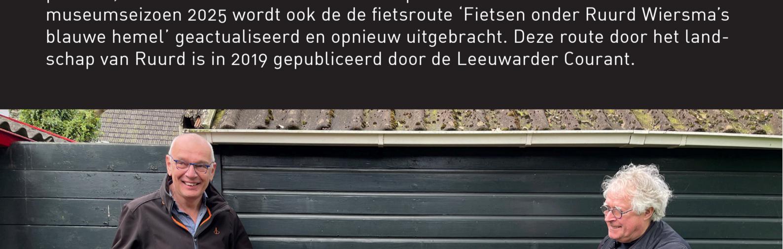
– Voorzitter Sybren van Tuinen en voormalig bestuurslid Oege Hiddema presenteren de fietsenrekken.

Het museum wil komend seizoen niet alleen de vindbaarheid en de zichtbaarheid in Burdaard vergroten, maar fietsende gasten ook meer voorzieningen aanbieden. De eerste stap bestaat uit het restylen en herplaatsen van twee opvallende fietsenrekken. Het bestuur overweegt, mits er toestemming is voor de plaatsing van zonnepanelen, ook het beschikbare stellen van oplaadfaciliteiten voor e-bikes. In het museumseizoen 2025 wordt ook de de fietsroute 'Fietsen onder Ruurd Wiersma's blauwe hemel' geactualiseerd en opnieuw uitgebracht. Deze route door het landschap van Ruurd is in 2019 gepubliceerd door de Leeuwarder Courant.